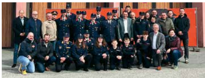
Große Vorfriede bei den Mitgliedern der FF Arnoldstein über den erfolgten Baustart

Die Gesamtkosten belaufen sich auf rund 1,6 Millionen Euro. Davon werden vom Land Kärnten zweckgebundene Mittel für Sicherheit und Katastrophenschutz von 1,0 Million Euro bereitgestellt und weitere 585.000 Euro darf die Gemeinde aus dem Kärntner Regionalfonds abrufen. Es entstehen Räumlichkeiten für die Feuerwehrjugend und -frauen, eine neue Garagenbox, zusätzliche Flächen für die Verbesserung der Lagerlogistik und die Generalsanierung des FF-Gebäudes.