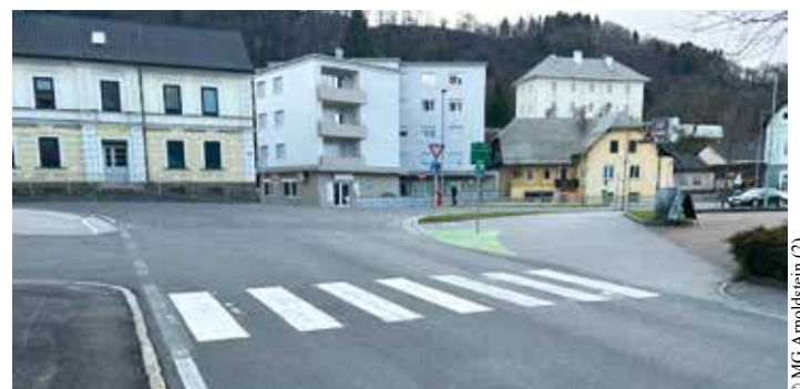
Schutzweg in der Nussallee wurde aus dem Kreuzungsbereich zurück verlegt.