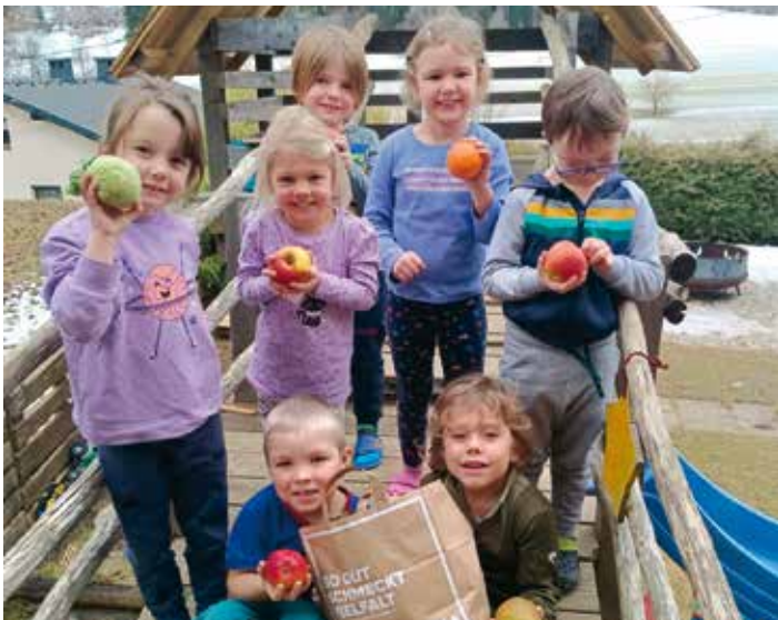
In den Wintermonaten schmecken die Vitamine in einem roten Apfel umso besser

Unter dieses Thema haben wir unser gesamtes Kindergartenjahr gestellt. Bereits schon das dritte Jahr arbeiten wir mit dem Land Kärnten gemeinsam als „Gesunder Verein“. Durch das Projekt „Schulobst- und Gemüseinitiative Kärnten“ erhalten wir wöchentlich Obst oder Gemüse für unsere Jause. Diese Initiative wird vom Land Kärnten und der Gemeinde Arnoldstein unterstützt. Seit September unterstützt uns aber auch der Billmarkt Arnoldstein bei unserem Vorhaben. So dürfen wir einmal in der Woche mit dem „Retter Sackerl“, welches wir kostenlos erhalten, eine leckere, gesunde Jause aus den Lebensmitteln zaubern, die für den Verkauf nicht den Kriterien entsprechen. Die Kinder lernen dadurch den wertvollen Umgang mit den Lebensmitteln und die Freude an der Zubereitung der Speisen. Ein großes Dankeschön an alle, die dieses Projekt unterstützen.