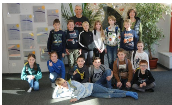
Tag der offenen Tür