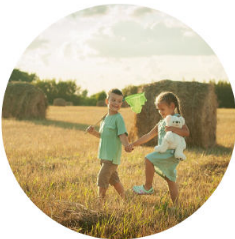
Umweltbildung bei Kindern und Jugendlichen