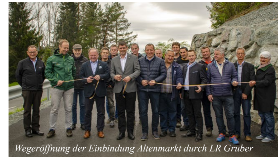
Wegeröffnung der Einbindung Altenmarkt durch LR Gruber

Einbindung Altenmarkt Marktgemeinde Weitensfeld anteilmäßig 40 % der Gesamtkosten: € 92.000,-