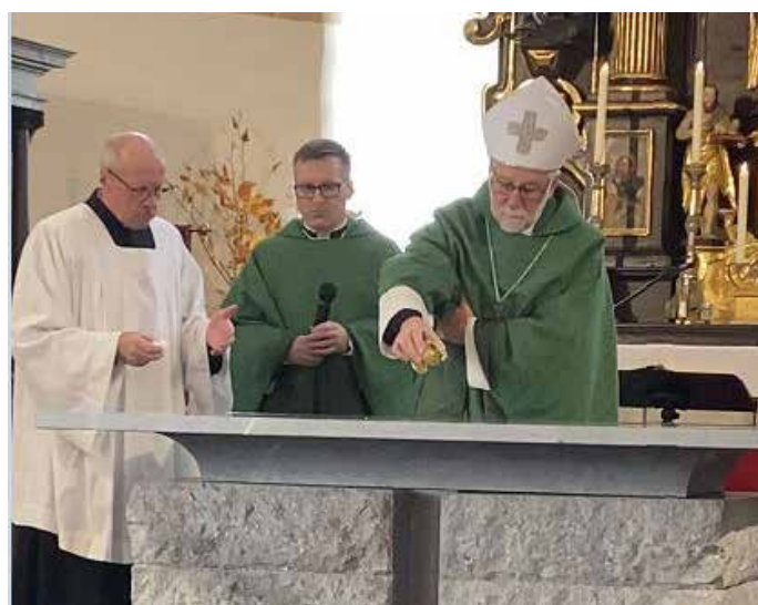
Altarweihe am 19. November 2023 in der Pfarrkirche Altenmarkt durch Diözesanbischof Josef Marketz

November 2023: Aufbau eines neuen Altars mit Ambo aus Marmor vom Steinbruch Lauster/Krastal.