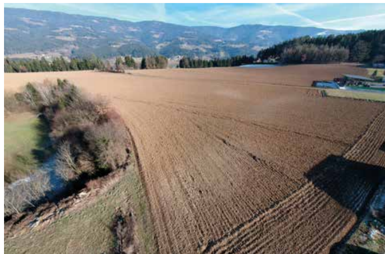
Das neue Baulandmodell Jurisiedlung II – hier entsteht demnächst die Aufschließungsstraße. Interessierte Häuslbauer können sich gerne schon vorab über die noch zur Verfügung stehenden Bauparzellen informieren (voraussichtlicher Verkaufspreis € 25,- pro m 2 ).