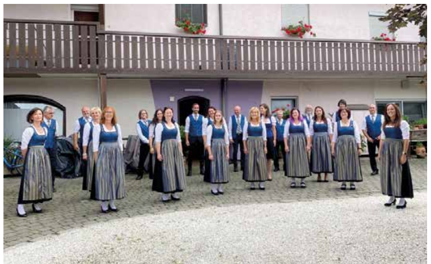
Grenz wacht 2022