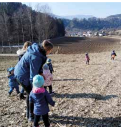
Die frühlinghaften Temperaturen werden auch für Spaziergänge auf die große Wiese genutzt.