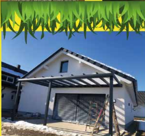
Glasdachsystem inkl. Markise