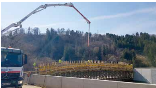
Hochwasserschutz Lavamünd: Die neue Geh- und Radwegbrücke über die Lavant am Drauspitz wird betoniert.