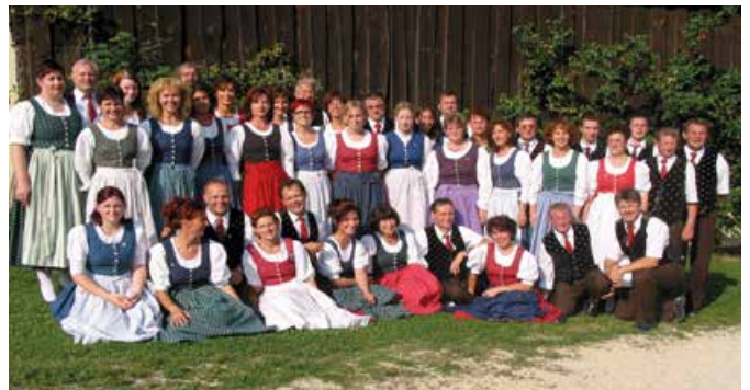
Grenz wacht 2002