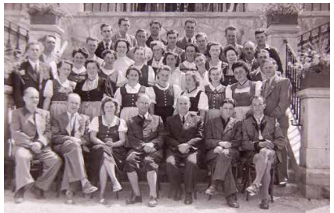
gemischter Chor 1952