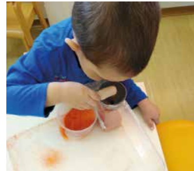
Wie viel Sand brauch ich noch damit die Flasche voll ist?