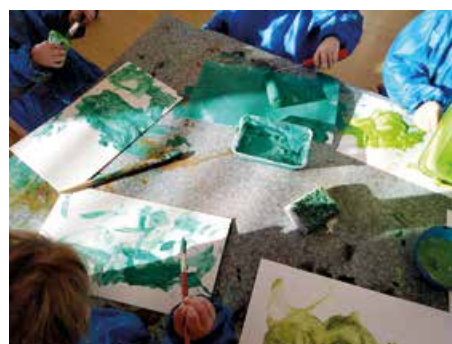
Die ersten Blumenwiesen werden schon gestaltet.