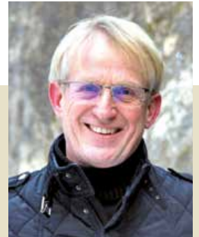
Bürgermeister Wolfgang Gallant (LWG)

Die Gemeinde Lavamünd nimmt in Kooperation mit der Gemeinde St. Georgen am Projekt „Community Nursing im Rahmen der Pflegenahversorgung“ teil.