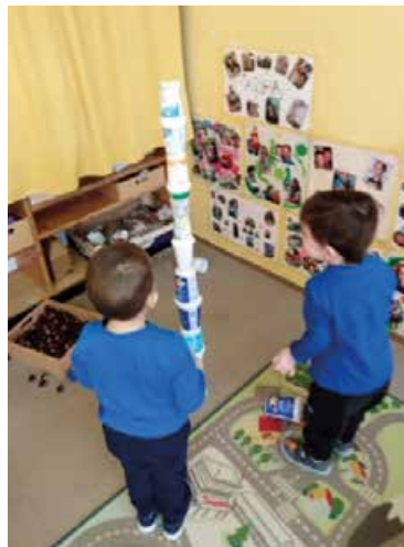
Wie hoch kann ich Joghurtbecher stapeln?