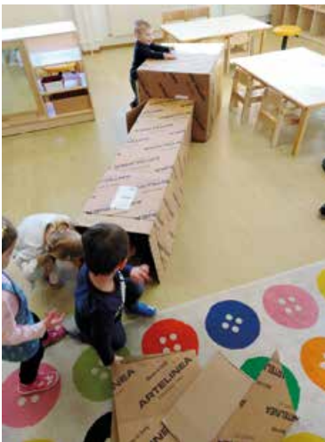
Aus Kartons werden Höhlen gebaut.

Den Kindern möchten wir diese 40 Tage Fasten so näher bringen, indem wir in dieser Zeit auf unser Spielzeug verzichten, denn auch Spielzeug braucht mal Urlaub. Im Gegenzug von Spielzeug, finden die Kinder jetzt in den Regalen verschiedenes Alltagsmaterial, wie z.B. Joghurtbecher, leere Küchenrollen, verschiedene Boxen, Flaschen, usw. Die Kinder erleben dadurch wieder ganz neue Erfahrungen und können mit dem Materialien ihrer Fantasie und Kreativität freien Lauf lassen. Durch diese spielzeugfreien Tage, wird danach unser Spielzeug auch wieder mehr wertgeschätzt.