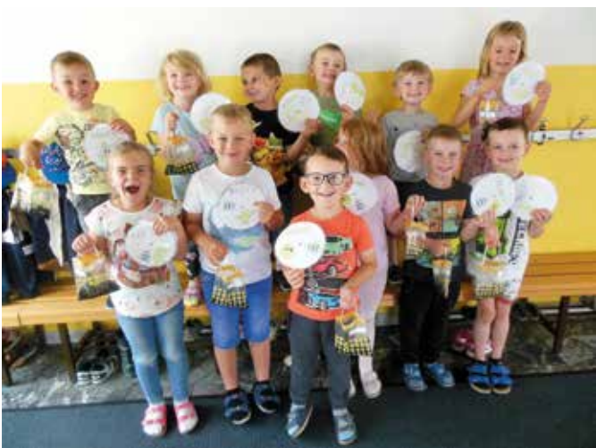
Erbsen im Gewächssackerl: Die einzelnen Wachstumsschritte der Erbsen wurden genau beobachtet. Die Kinder konnten die Erbsenpflanze mit nach Hause nehmen, sie im Garten oder in einen Topf einsetzen und weiter versorgen, beobachten und die fertigen Erbsen verzehren.