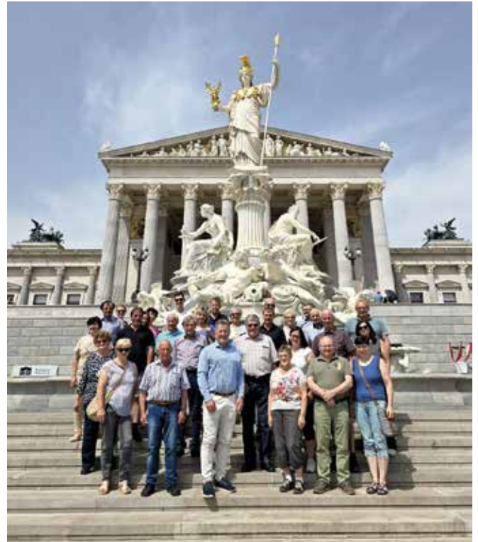
Parlamentsbesuch in Wien