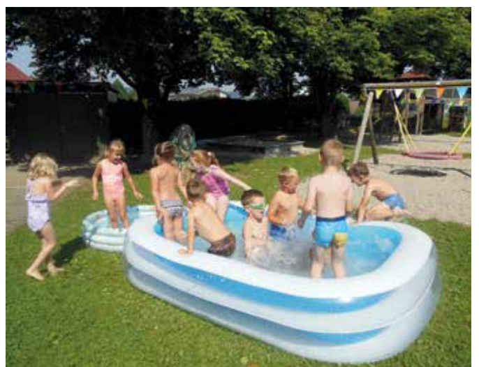
Badetag im Kindergarten. Die letzten heißen Tage vor unseren Ferien konnten wir mit lustigen Wasserspielen in unserem Garten verbringen.