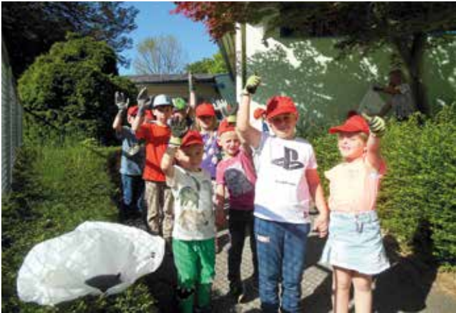
Müllsammeln in der Umgebung des Kindergartens in Ettendorf.

Der Sommer hält nun Einzug und so blicken wir wieder auf viele schöne und lustige Erlebnisse und Aktivitäten in unserem Kindergarten zurück.