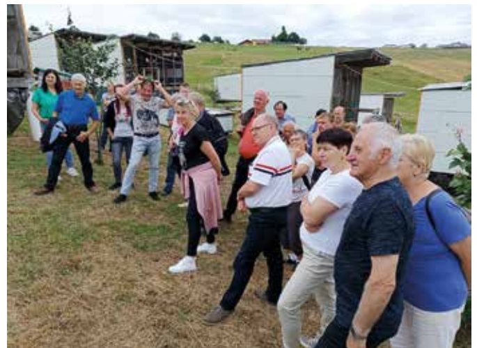
Gespanntes Zuhören über die Taubenzucht