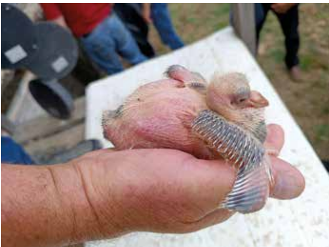
Jungtaube mit wachsendem Federkleid