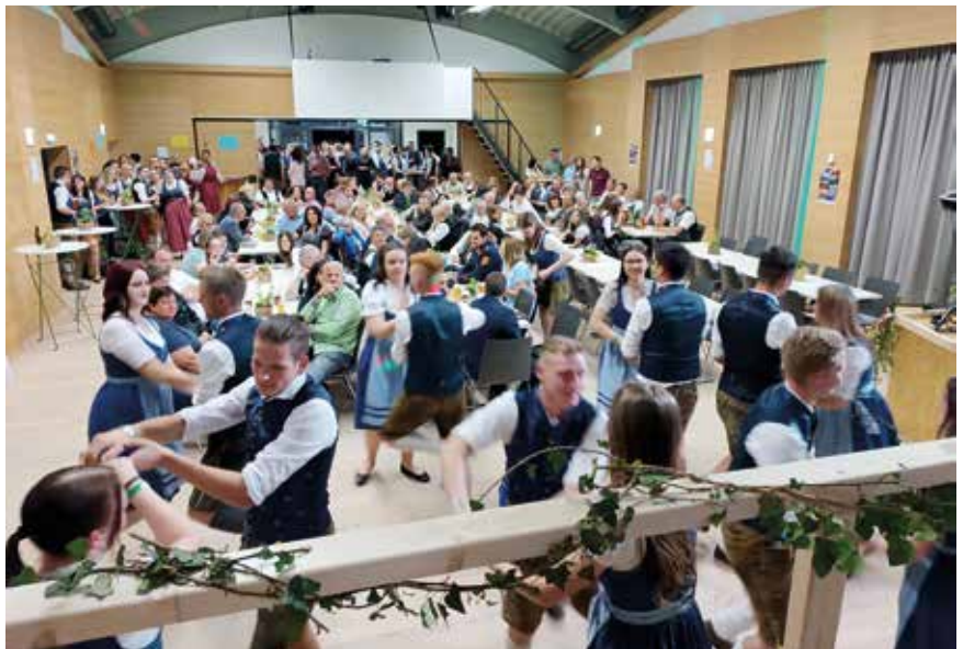
Mitternachtseinlage der LJ St. Georgen