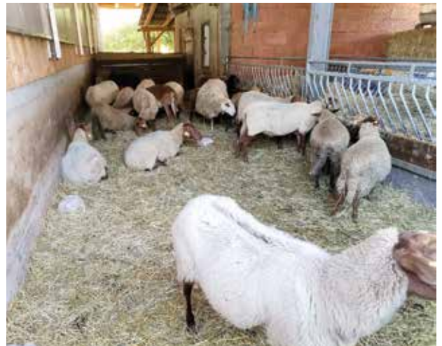
Im Vordergrund: „Coburger Fuchsschaf“

Gemeinsam mit seinem Sohn, der mittlerweile ausgebildeter Fleischhauer ist, werden alle Schafe ab Hof vermarktet. Das bedeutet, dass wöchentlich rund 10 bis 20 Schafe vermarktet werden. „Der Kunde muss zu mir kommen“, meint der Shoafbauer und wir bemerken auch während unseres Besuches reges Kundeninteresse.