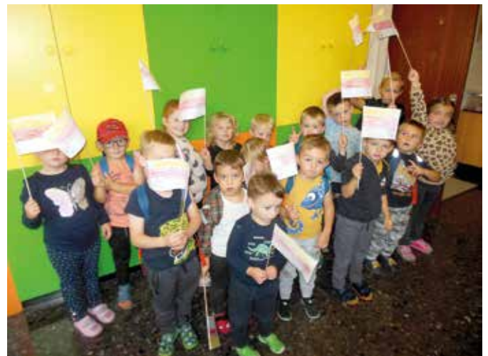
Unsere schönen Fahnen