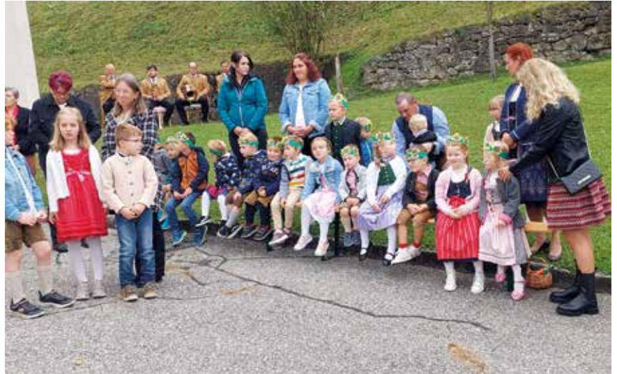
Erntedankfest in Ettendorf

Das Erntedankfest in Ettendorf wurde von den Kindergartenkindern mit Liedern und einem Gedicht mitgestaltet.