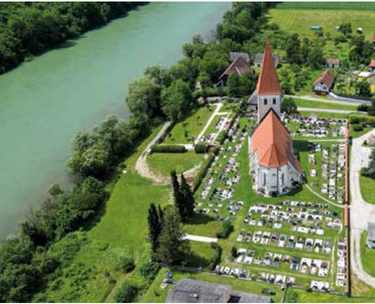
Die Friedhofsgebühren in unserer Gemeinde werden für die Jahre 2024 bis 2028 neu vorgeschrieben.

Mit 10 Stimmen der LWG und VP wurde die Änderung beschlossen. Die Mitglieder der SPÖ-Fraktion sowie 1 Mitglied der LWG enthielten sich der Stimme, das FPÖ-Mitglied stimmte dagegen.