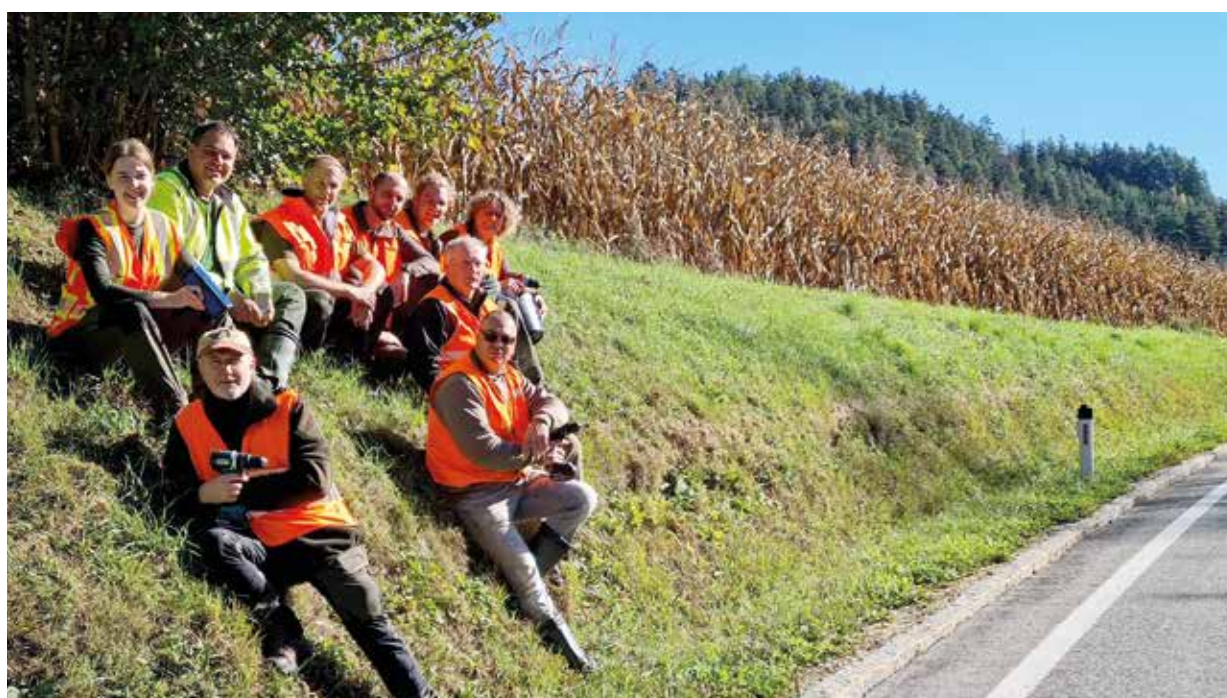
Die Montage der Wildwarner wurde von den Jägern des Jagdvereins Lavamünd durchgeführt.