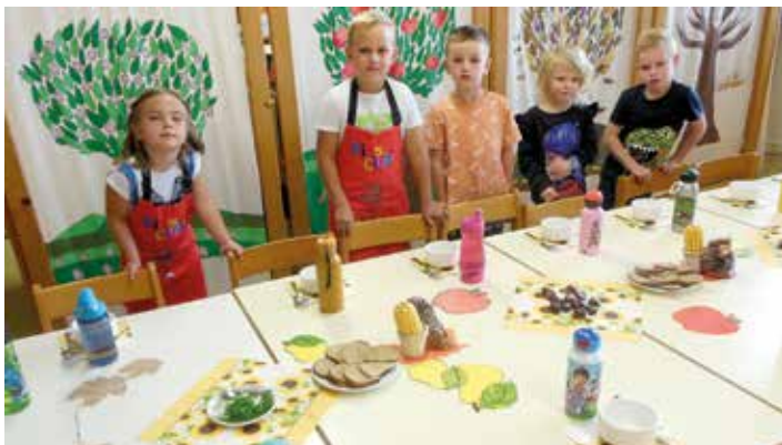
Wir decken den Erntedanktisch

Beim Tag der älteren Generation, unserem „ Opa – Oma Tag “, wurden die anwesenden Gäste mit Liedern und Gedichten überrascht. Die Kinder teilten den Gästen Kräutersalze, die im Kindergarten gemischt und abgefüllt wurden, aus.