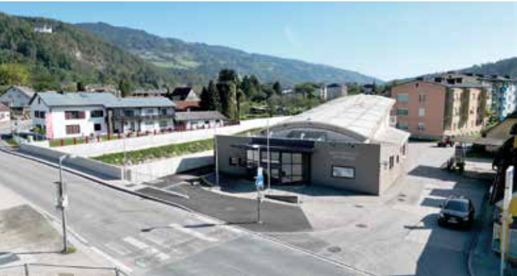
Eine Bushaltestelle beim Kulturhaus Lavamünd steht zur Diskussion