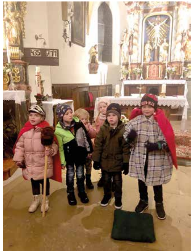
Laternenfest in der Pfarrkirche in Ettendorf