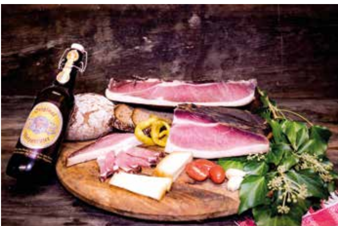
Kennzeichen ist der schneeweiße Speck

Dort angekommen besichtigten wir den Gailtaler Speckbauern Fam. Smole in St. Stefan im Gailtal. Um den Gailtaler Speck produzieren zu dürfen, muss vor allem das richtige Futter eingesetzt werden. Es ist vorgeschrieben, dass nur ein geringer Maisanteil verwendet werden darf. Für die schneeweiße, kernige Speckqualität ist ausschließlich das Getreide verantwortlich. Nach einer kurzen Verköstigung nahmen wir das Mittagessen im Gasthaus Smole ein.