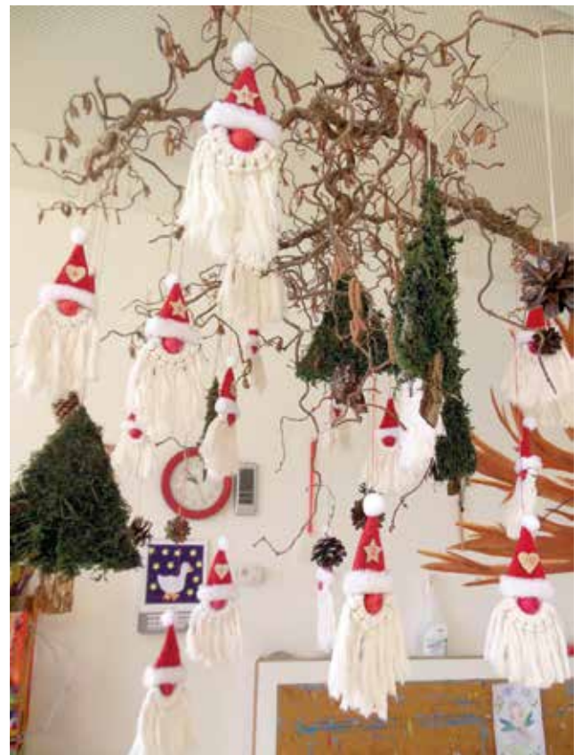
Unser Adventkalender im Kindergarten

Wir wünschen allen ein besinnliches Weihnachtsfest und ganz viel Glück und Erfolg im neuen Jahr 2024.