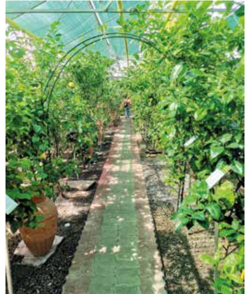
„So erntet man Zitronen“

Nach einer kräftigen Jause in der Buschenschenke Kordesch am Sablatnigmoor konnten wir die Heimreise antreten. Vielen Dank für die rege Teilnahme und die lustigen Stunden. 2024 wird der Bauernausflug wieder zweitägig sein.