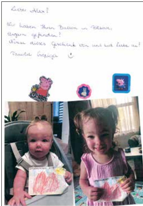
Post aus Ungarn

Beim Tag der älteren Generation, unserem „ Opa – Oma Tag “, wurden die anwesenden Gäste mit Liedern und Gedichten überrascht. Die Kinder teilten den Gästen Kräutersalze, die im Kindergarten gemischt und abgefüllt wurden, aus.