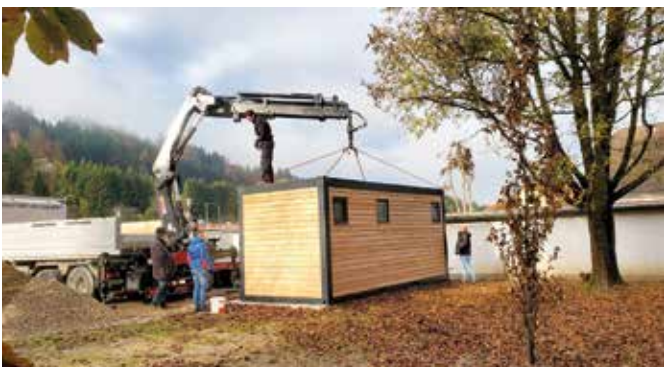
Neue WC-Anlage am Drauspitz