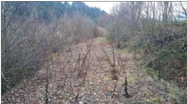
Die aufgelassene Bahntrasse holt sich die Natur langsam zurück