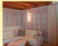
Rundstangen & Vorhänge