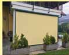
Sonnen- & Sichtschutz