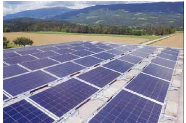
Am Dach des Rüsthauses in Unterbergen wurde eine Photovoltaikanlage installiert

tovoltaikanlage am Dach des Rüsthauses getroffen. Die Anlage wurde mittlerweile montiert und soll zu Einsparungen beim Stromverbrauch bzw. bei den Stromkosten führen.