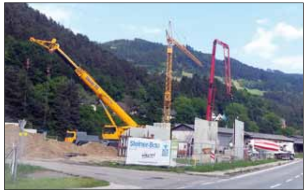
Der Bau der Nahwärme Lavamünd setzte nicht nur wirtschaftliche Impulse wie hier am Foto bei der Errichtung der Zentrale, es gibt mittlerweile auch einen hohen Anschlussgrad bei den Mietwohnungen und öffentlichen Gebäuden