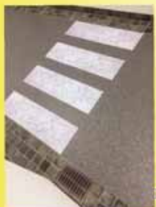
Designbelag aufwendig verarbeitet

9473 Lavamünd 36/37 Tele. & Fax 04356/21114 0664/ 19 00 779 LacknerHermann@aon.at