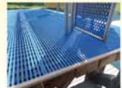
spezielle Beläge bzw. Matten