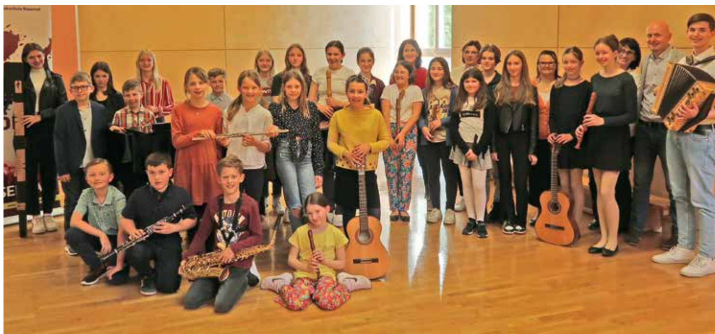
Frühlingskonzert der Musikschule Maria Rain