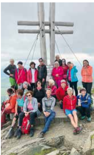
Rundwanderung Rodresnock - Falkertspitz