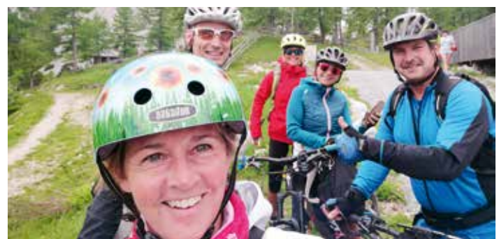
Mountainbike-Tour zur Klagenfurter Hütte