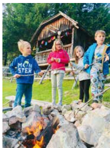
Alljährliche Begeisterung bei den Kinderbergwochenenden auf der Kobounigalm/Koschuta