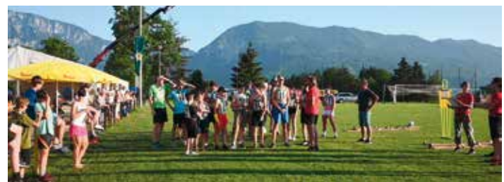
Rege Teilnahme bei der Langen Nacht des Sports