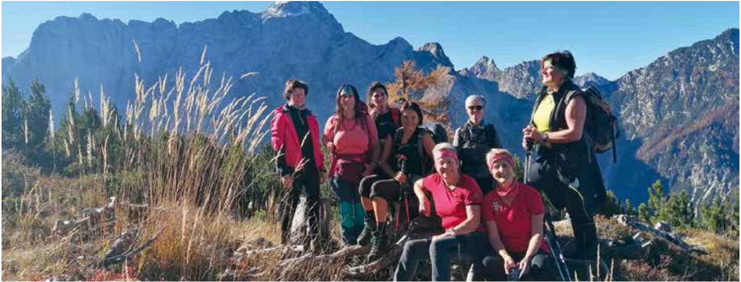
Rundwanderung oberhalb der türkis und blau schimmernden Weissenfelder Seen mit herrlichem Ausblick ins Tal und zu den westlichen julischen Alpen