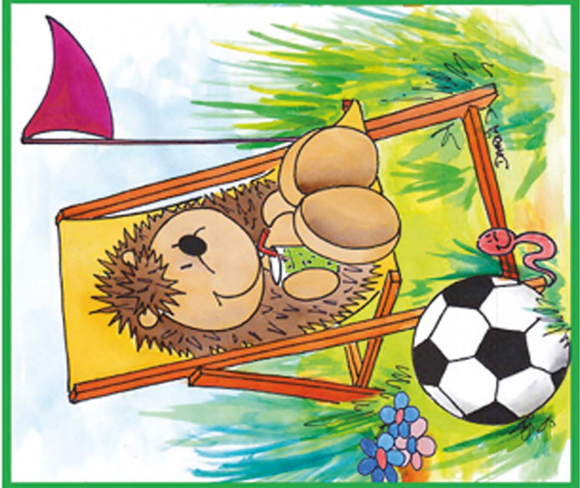
Daria Broda, www.knollmaennchen.de Kinder-Sommerrätsel - Finde die Fehler