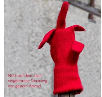
Noch auf dem Zaun eingefrorene Stimmung von gestern Abend

Täglich geöffnet von 11 – 16h; Eintritt frei!