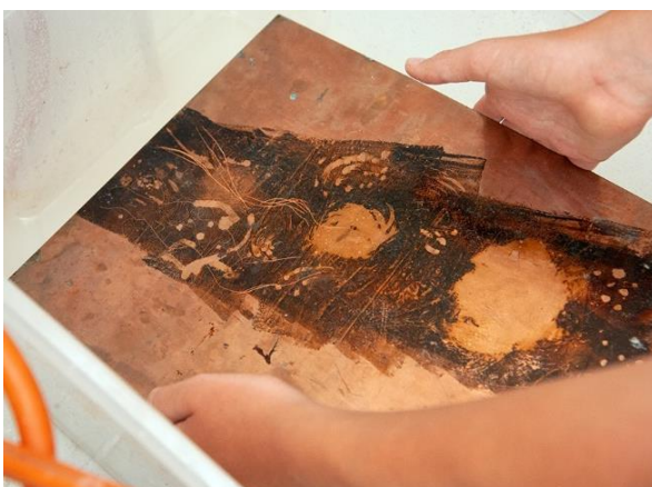
Radierung auf Kupferplatte