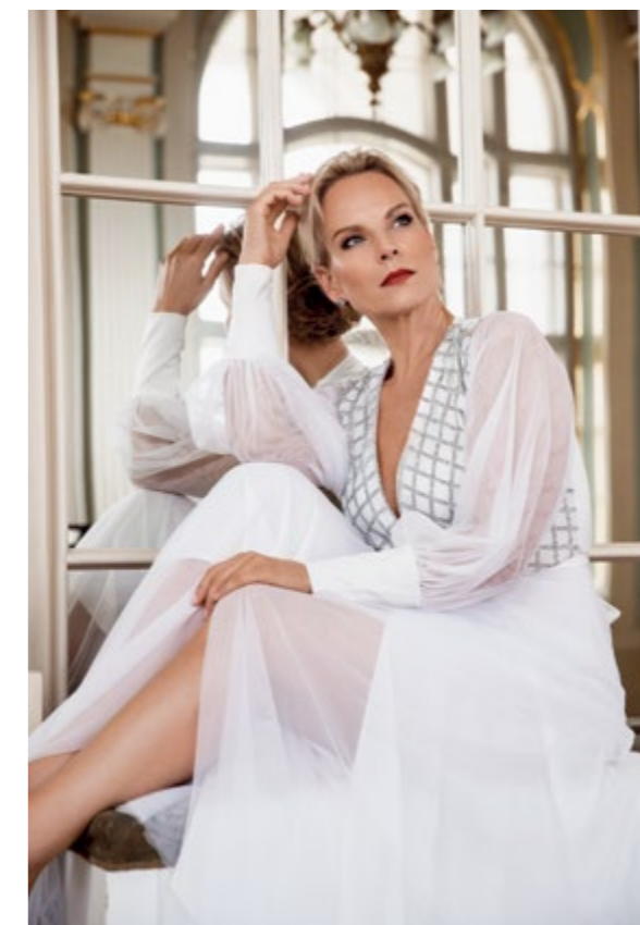
Bereits zum dritten Mal tritt Elina Garanča im Rahmen der Musikwochen Millstatt auf.