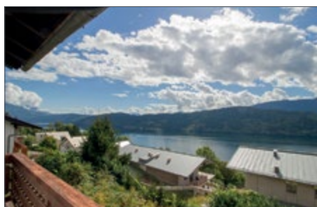
MILLSTATT AM SEE