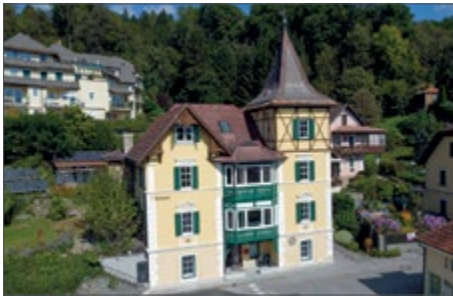
MILLSTATT AM SEE