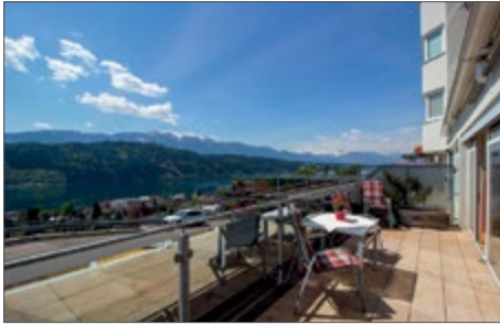
MILLSTATT AM SEE