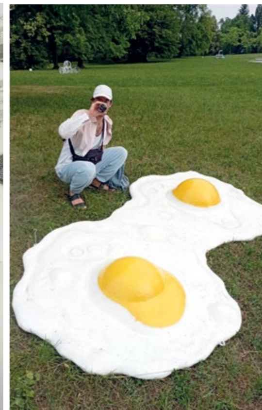
MillStart _SunnySideUp_couplegoals