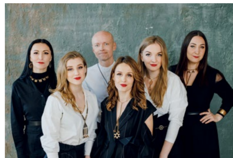
Das lettische Vokalensemble „Latvian Voices“ wird passend zum Muttertag ein Konzert in der Stiftskirche am 12. Mai 2024 zum Besten geben.

Bunt ging es auch nach dem Fasching weiter. Es gab viele Aktionen zum Thema „Kunterbunte Farbenwelt“ und wir tauchten in die Welt der Gefühle ein. Das schöne Wetter nutzen wir aus und verbringen sehr viel Zeit im Garten. Die ersten Blumen wurden entdeckt und die ersten Insekten nach dem Winter bewundert. Mit viel Freude und Liebe haben wir den Osterstrauch dekoriert und den Garten frühlingsfit gemacht.