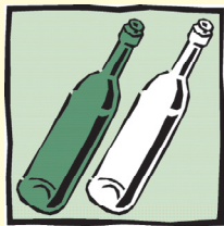
Bunt- bzw. Weißglasbehälter